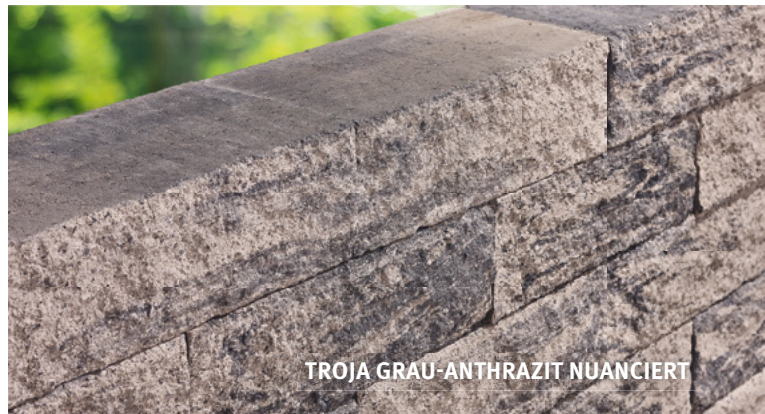
TROJA GRAU-ANTHRAZIT NUANCIERT